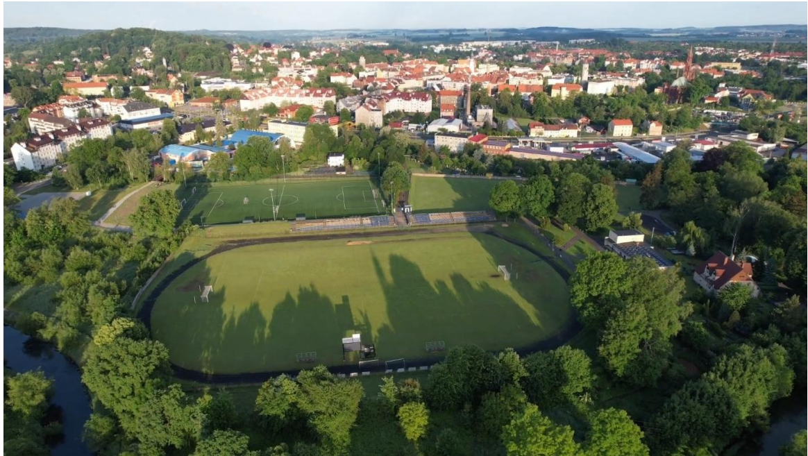
Zdjęcie 6 Stadion w Lubaniu przy ul. Ludowej przed modernizacją