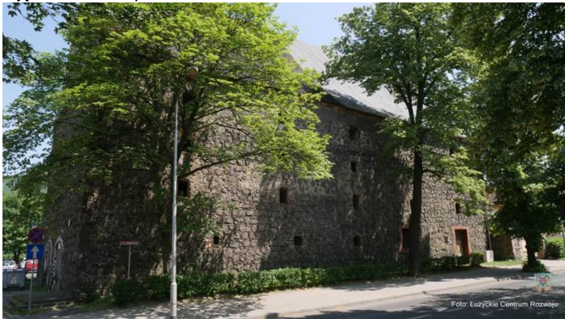
Zdjęcie 13 Dom solny