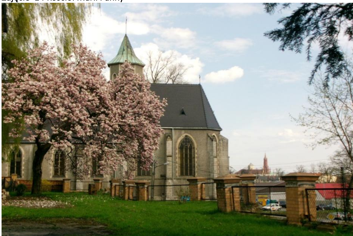
Zdjęcie 14 Kościół Marii Panny