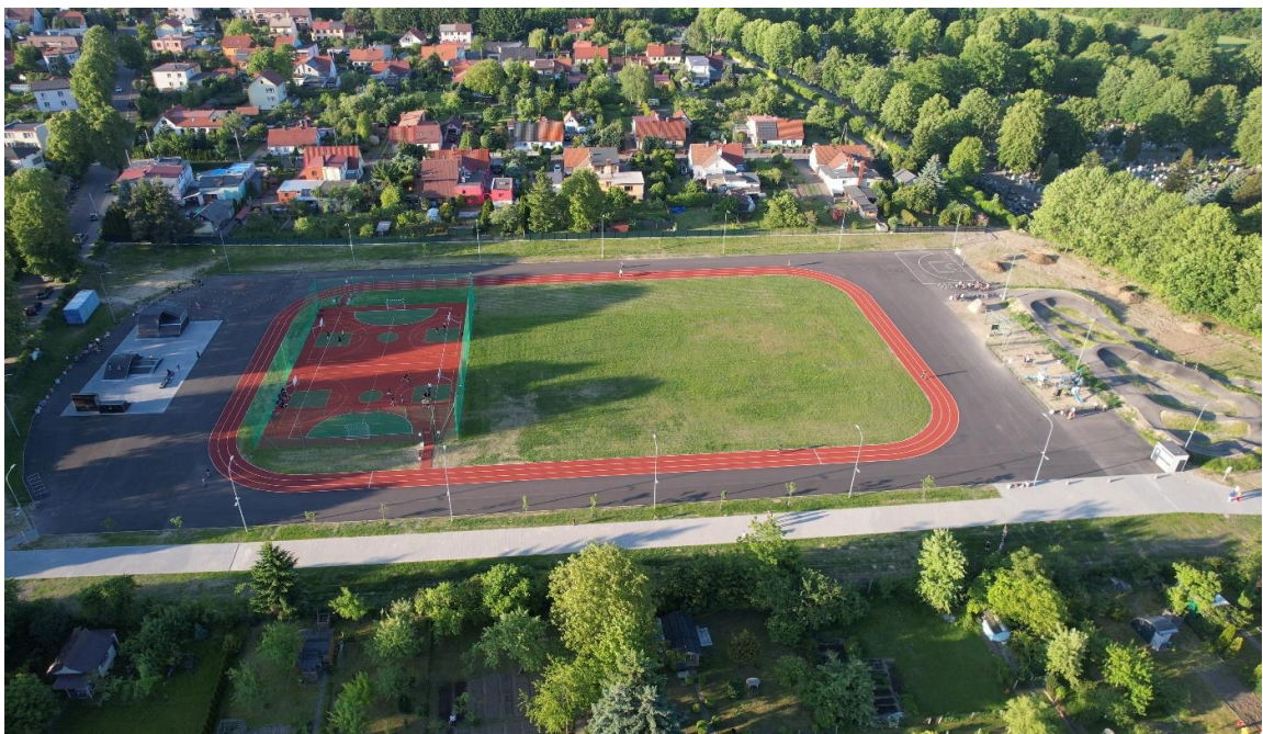
Zdjęcie 5 Wielofunkcyjne obiekty sportowe przy ul. Działkowej w Lubaniu