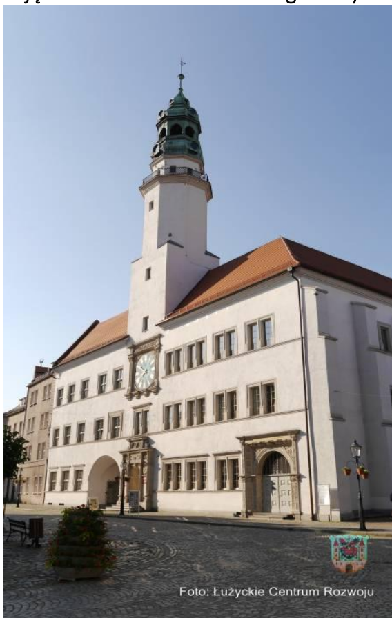
Zdjęcie 10 Ratusz z Muezum Regionalnym