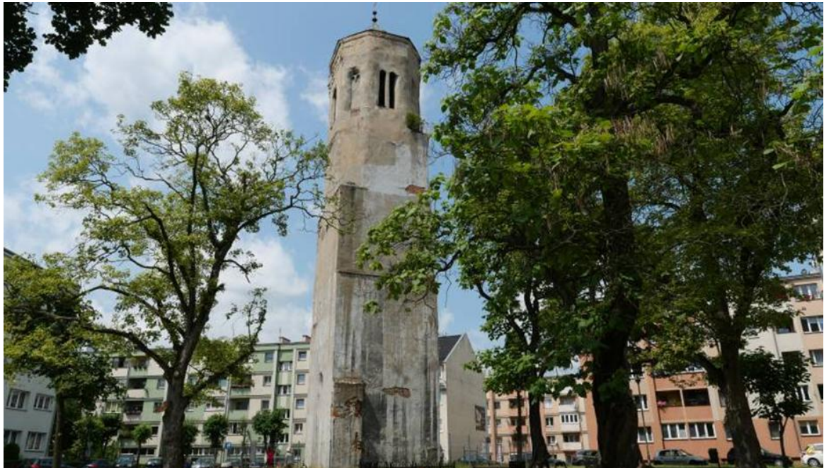
Zdjęcie 11 Wieża Trynitaraska