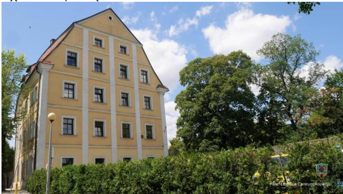
Zdjęcie 12 Dom pod okrętem