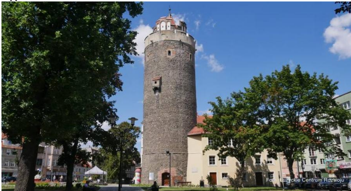
Zdjęcie 8 Wieża Bracka