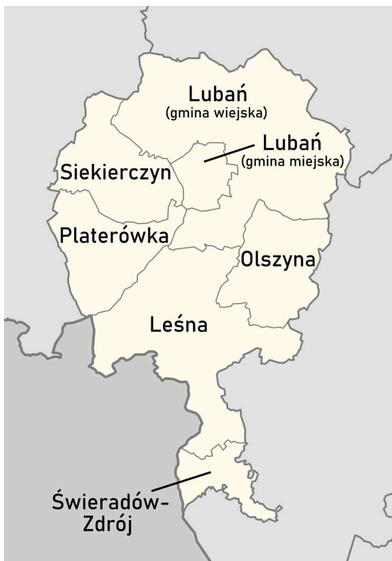
Mapa 1 Położenie Miasta Lubań na mapie powiatu lubańskiego