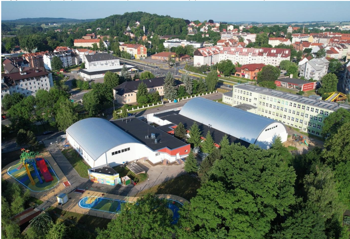
Zdjęcie 4 Kryta pływalnia, hala sportowa i wodny plac zabaw z lotu ptaka