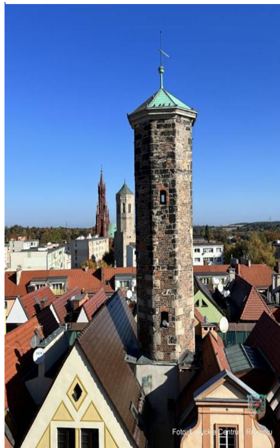
Zdjęcie 9 Wieża Kramarska