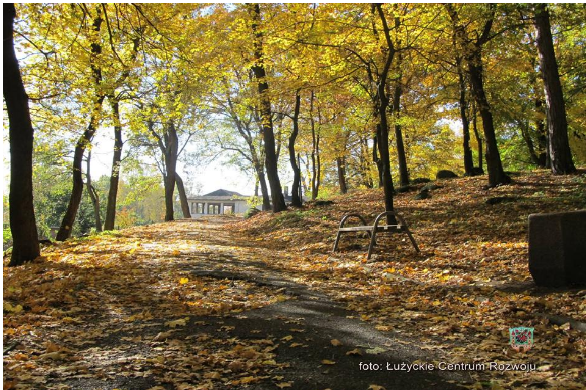
Zdjęcie 16 Park na Kamiennej Górze