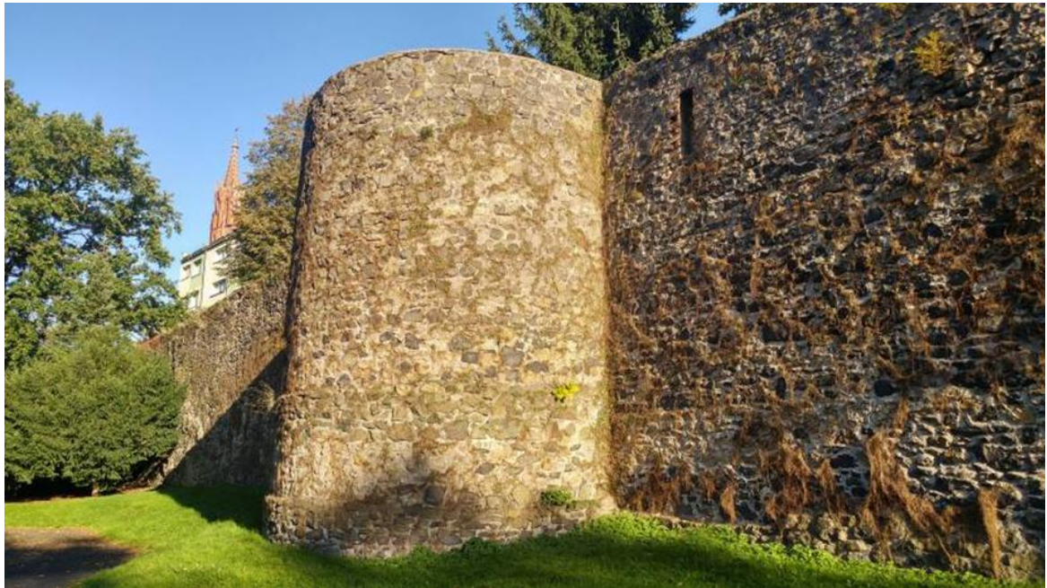
Zdjęcie 15 Mury obronne