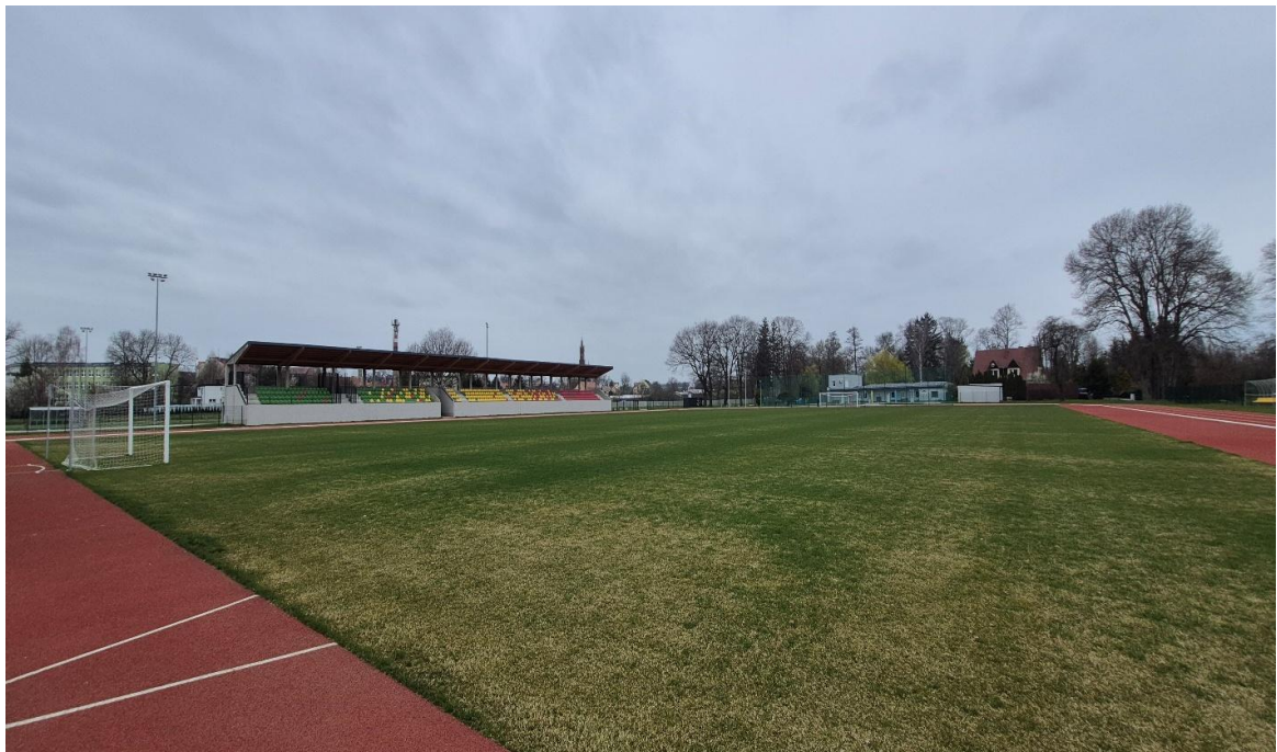
Zdjęcie 7 Stadion w Lubaniu przy ul. Ludowej po modernizacji